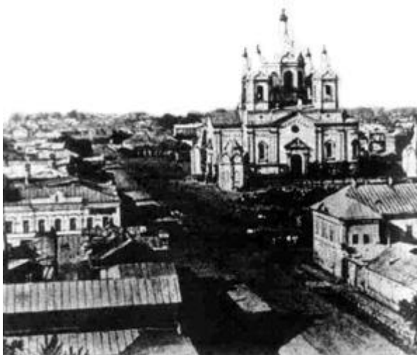
Соборный храм Тамбова

в Тамбове и Мичуринске. Имея много свободного времени, я и в Тамбове около двух лет совмещал церковное служение с работой в госпиталях для раненых.